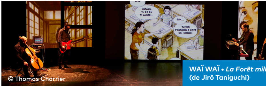
WAÏ WAÏ • La Forêt millénaire (de Jirô Taniguchi)

Suite au divorce de ses parents et à la maladie de sa mère, Wataru est accueilli par ses grands-parents à la campagne. Cette nouvelle vie est un bouleversement pour le jeune tokyoïte. Il explore sa nouvelle école et découvre un environnement fascinant, notamment la forêt qui semble lui transmettre une force presque surnaturelle. Ce BD-concert offre une exploration visuelle et sonore de ce voyage, mettant en avant les textures impressionnistes des dessins expressifs et du travail d'aquarelle de l'auteur. Waï Waï compose avec cette même sensibilité la bande son rêvée pour accompagner Wataru, jeune héros citadin bouleversé par un exil contraint vers la campagne japonaise.